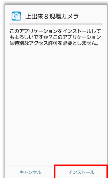
図 2. インストールのボタンが反応しない場合

アプリによっては再設定やデータの再ダウンロードが必要になります。ご注意ください。